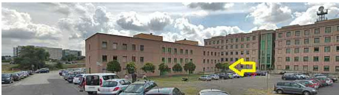
Foto presa dai parcheggi